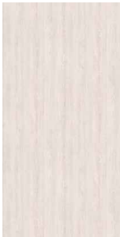
Y1R-雪花橡木 White Oak