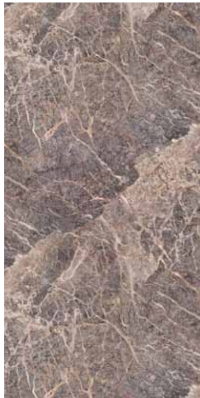
Z05-麗緻風華 Ritz Glamor