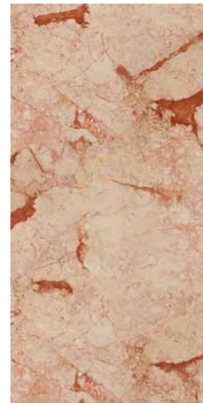
Z0C-瑪瑙米黃 Fethiye Beige