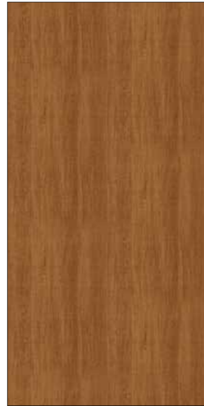
Y04-原切柚木 Cutting Teak