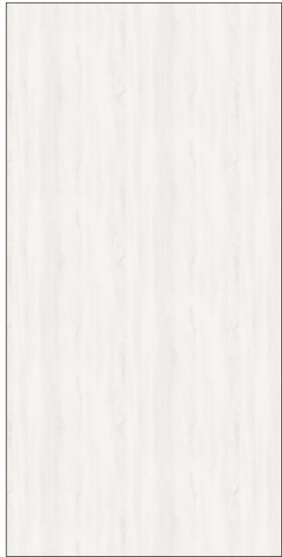
Y01-原切白栲 Original Cutting white ash