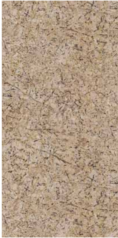
Z01-冬之戀 Winter Love