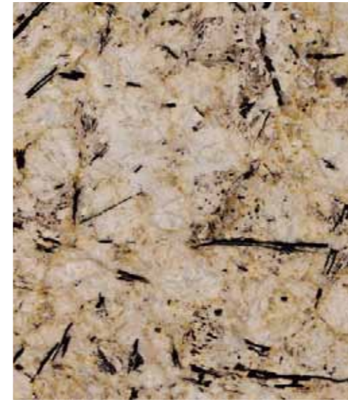
Z01 冬之戀 Winter Love