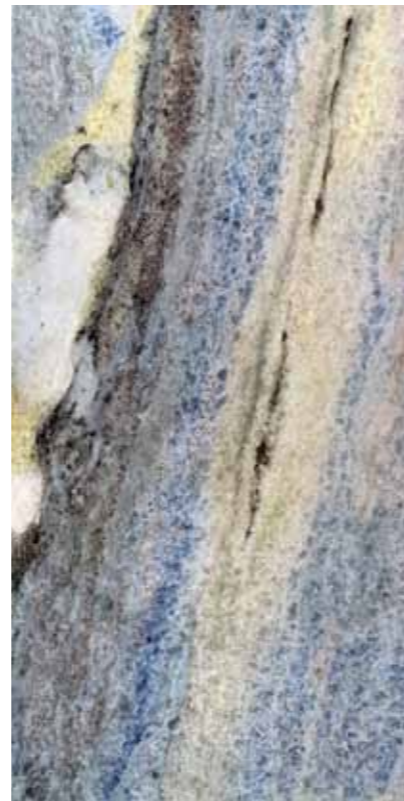
Z0Z-日出 Sun Rise