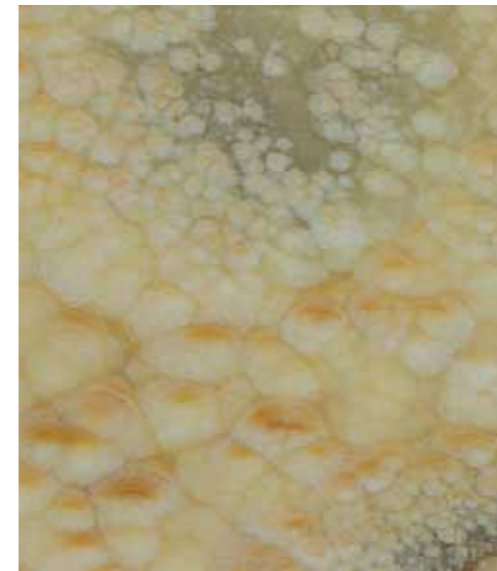
Z02 墨西哥黃玉 Mexican Topaz