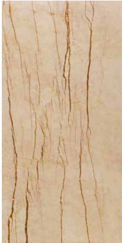
Z0E-櫻木花道 Cherry Blossoms Tree