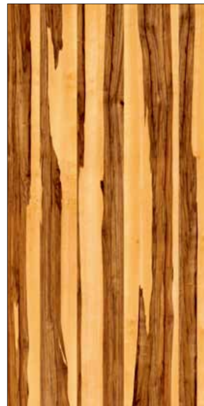
Y08-緞翅木 Satin wood