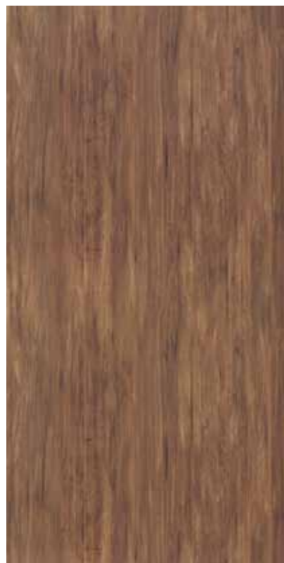
Y1Q-古胡桃木 Antique Walnut