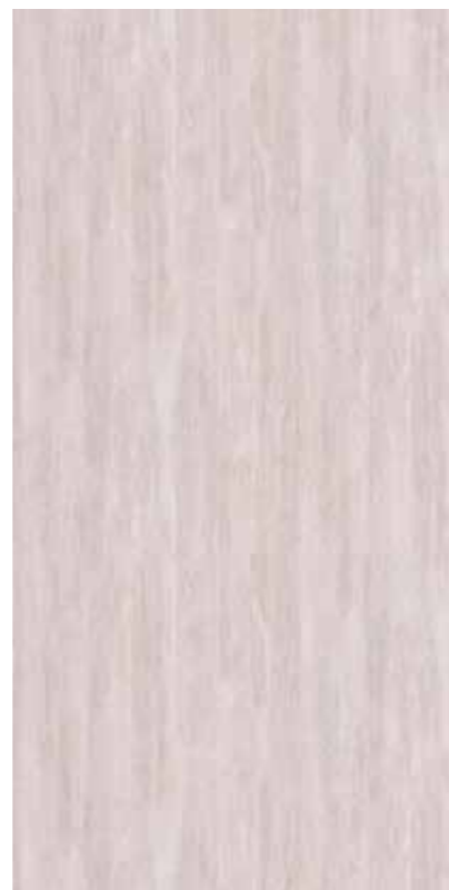
Y1S-粉晶橡木 Pink Oak