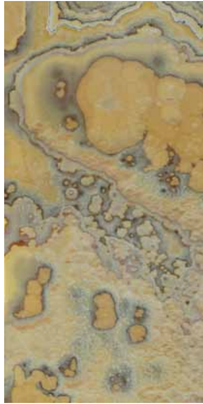
Z02-墨西哥黃玉 Mexican Topaz