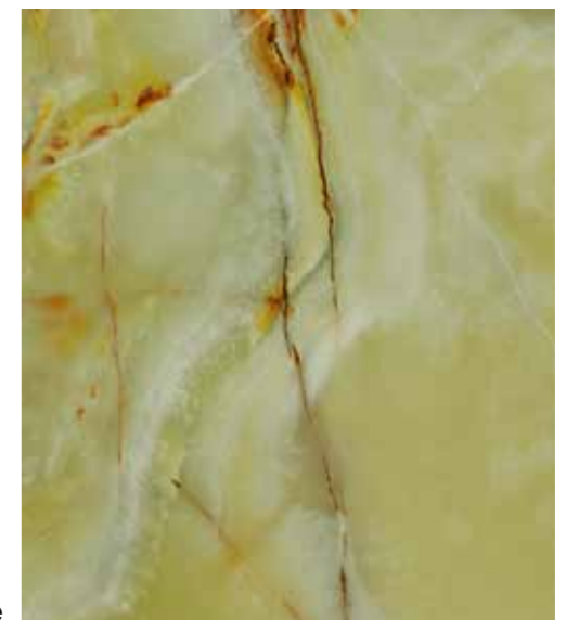
Z07 青玉石 Green Onyx-B