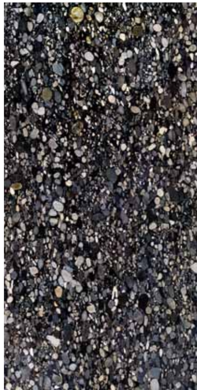
Z0Y-上帝馬賽克 Fantasy Mosaic