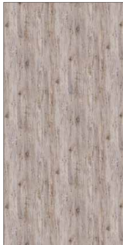
Y07-古木 Classic Wood