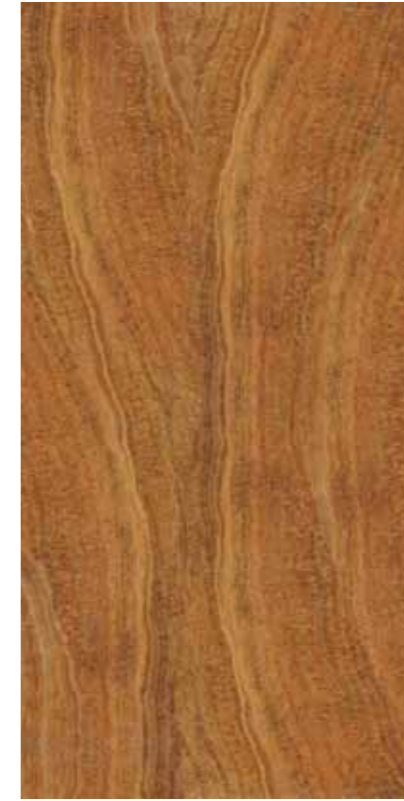
Z09-黃金木紋玉 Golden Wood Grain Onyx