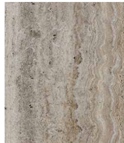
Z03 墨西哥洞石 Mexican Travertine