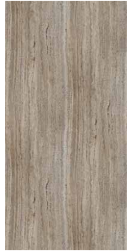
Z03-墨西哥洞石 Mexican Travertine