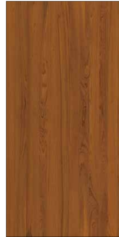
Y16-黃金柚木 Gold Teak