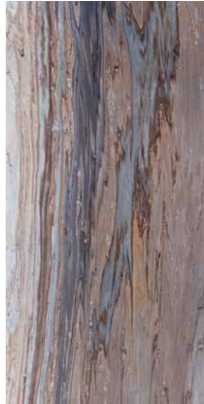
Z0W-蔚藍海岸 Costa d'Azur