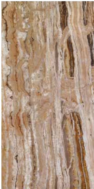
Z0X-山水石景 Travertino Romano