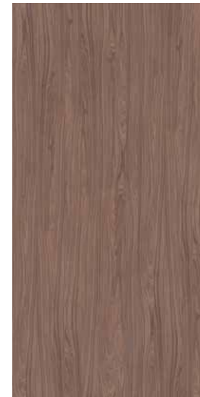
Y0G-玫瑰木 Rose wood