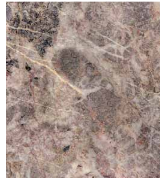
Z05 麗緻風華 Ritz Glamor