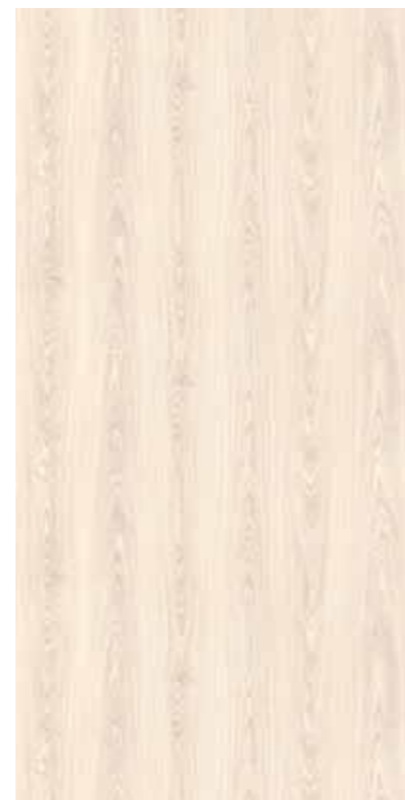
Y0D-古典白橡 Classic White Oak