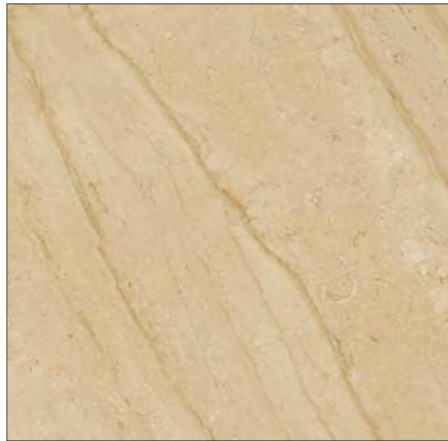
Z08 帝諾 TINO

Marble Series varied texture, for bringing home the fantasy space for home add natural flavor of the original, for the home to create a unique pattern can certainly increase the uniqueness of the home and the illusion of space. Stone also easily mix of materials, such as wood and metal complexes, with a sense of warmth of wood, stone soften tough cold, bring out the natural flavor of the doctrine relaxed.