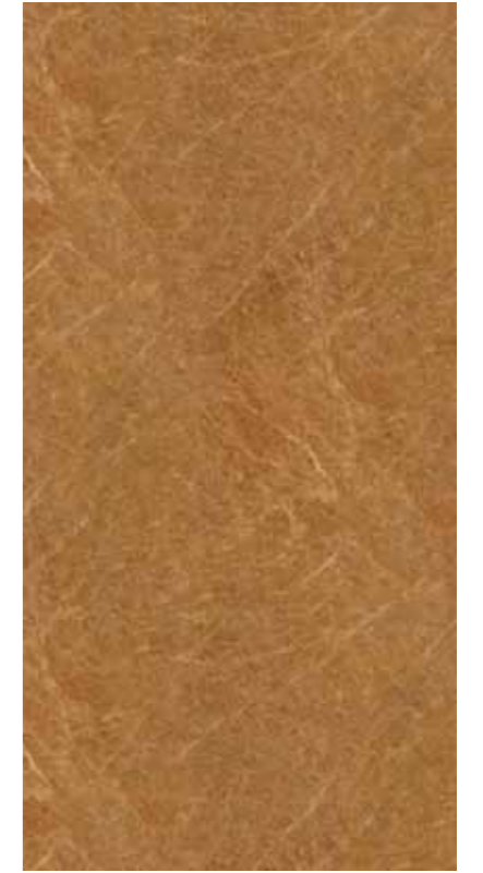
Z0A-黃金淺金鋒 Golden Light Emperor