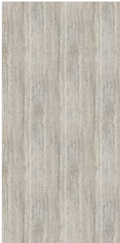
Z04-普羅旺斯洞石 Travertine Provence