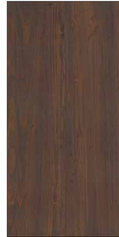
Y17-深刻胡桃 Deep walnut