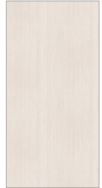
Y18-白栲 White ash