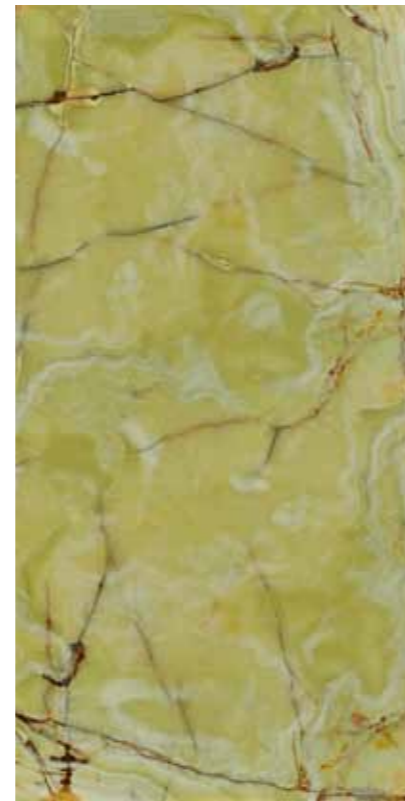
Z07-青玉石 Green Onyx-B