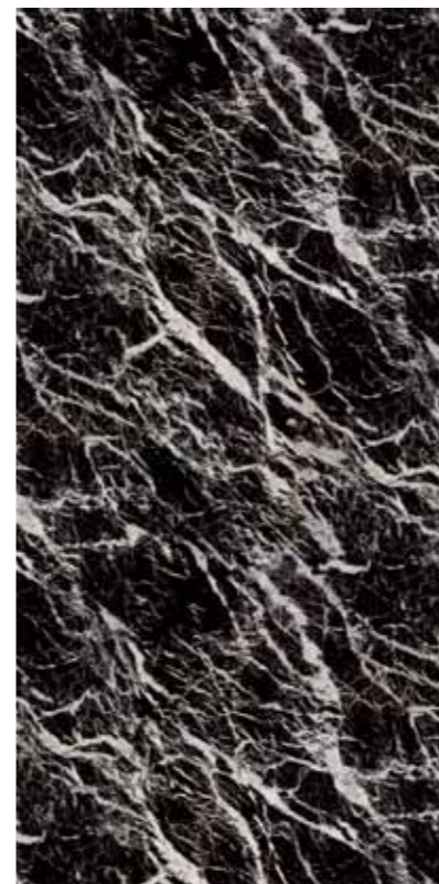
Z0B-義大利黑網石 Italian Black Marble