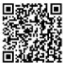
塑三部 壁板材網頁