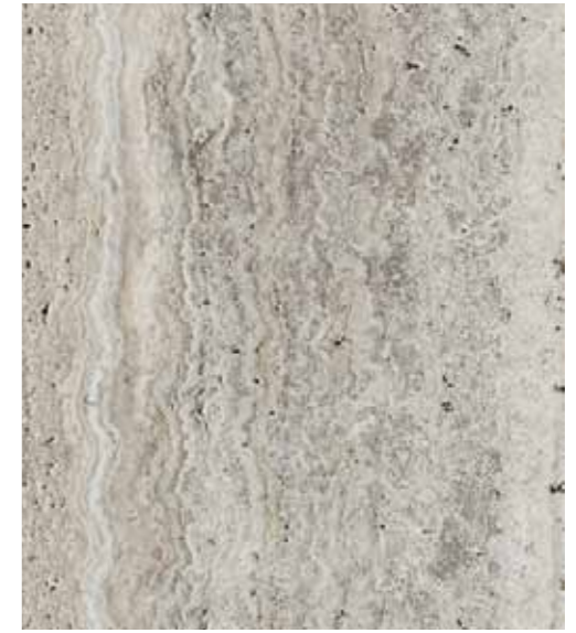
Z04 普羅旺斯 洞石 Travertine Provence