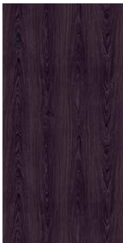
Y1W-黑橡木洗白 Dark Oak