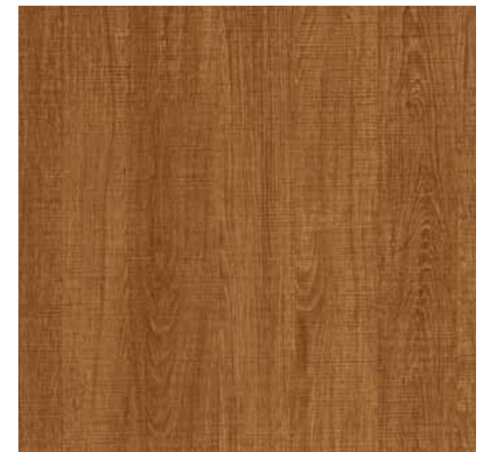
Y04 原切柚木 Original Cutting Teak

Wood Series can be broadly divided into dark lines, bright colors and yellowish color, etc., and also different wood to bring people of different feelings. Changes such as maple delicate lines, gives people comfortable, clean feeling; walnut grain retro flavor is excellent, stable texture, color and delicate-looking; teak moist texture all Nordic style, so add a little of the warmth of home and more.