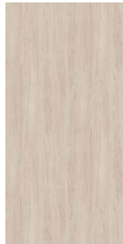
Y0E-田園橡木 Rural Teakt