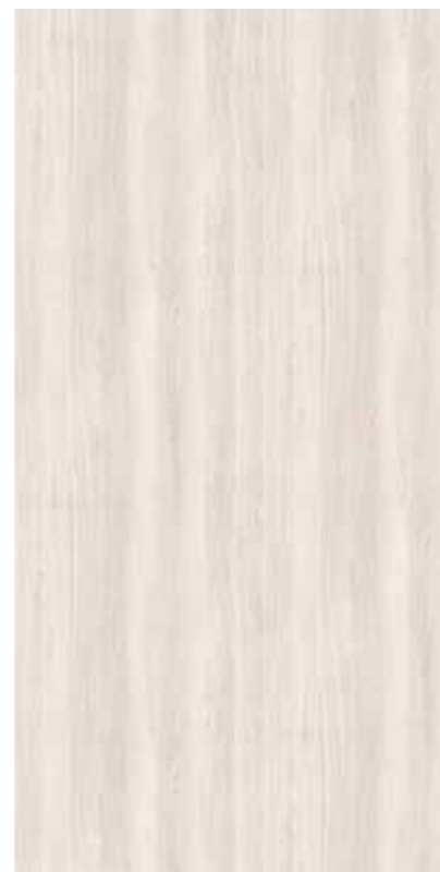
Y0C-北歐白橡 Nordic White Oak