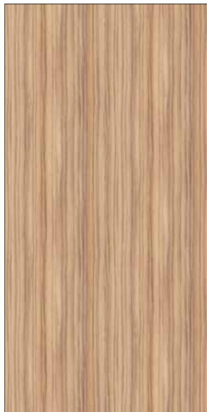
Y06-可可木 Coconut Wood