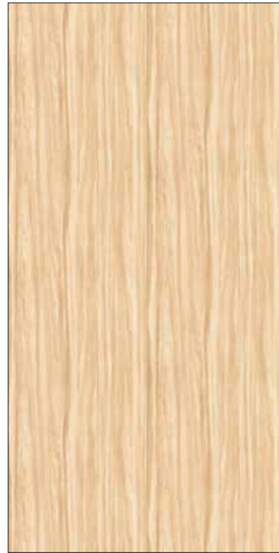
Y03-納米亞楓木 Namia Maple