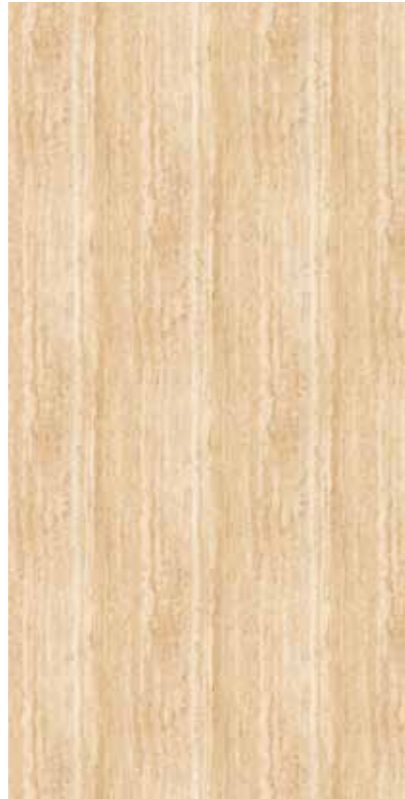
Z0T-米黃洞石 Travertino Beige